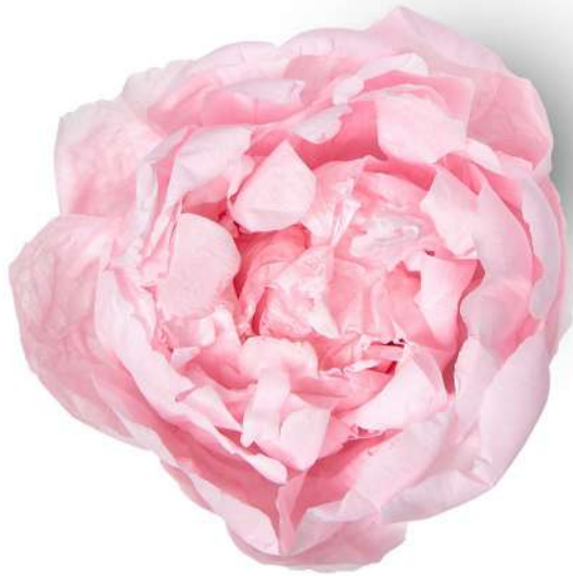
Peonia / Pastel Pink PEO/2420