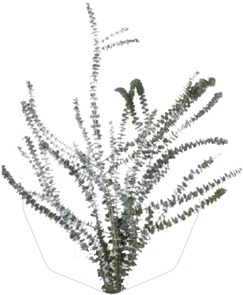
Baby Blue BBL/4103