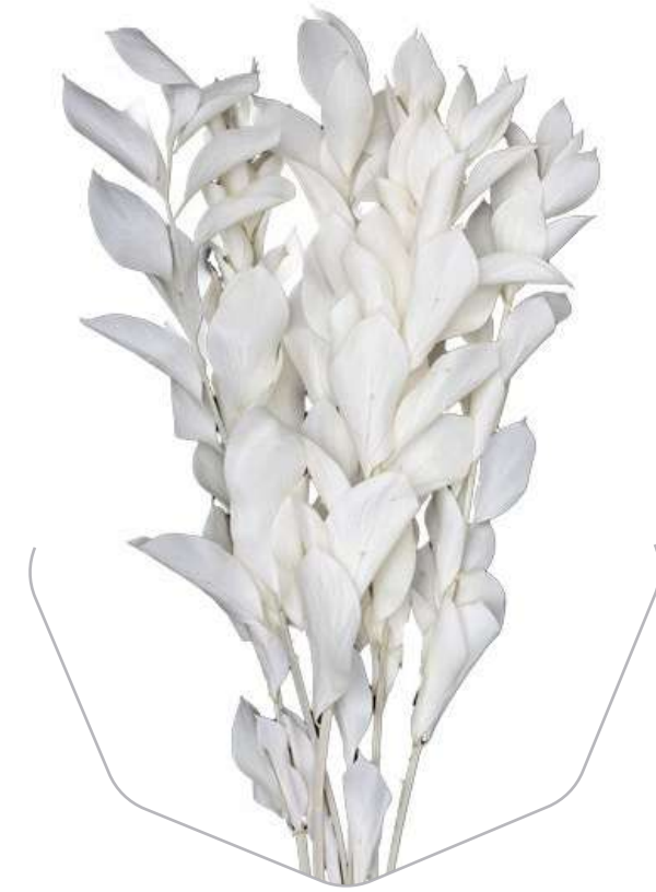
White Ruscus RUS/0005