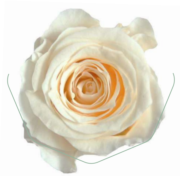
Rosa Princess Champagne RSP/4020