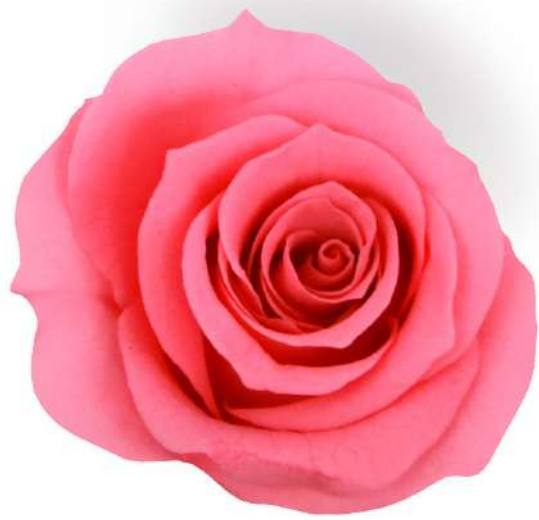
Rosa Princess / Pastel Pink RSP/4420