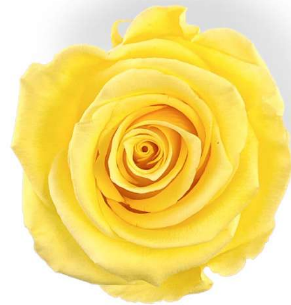
Soft yellow RST/2330