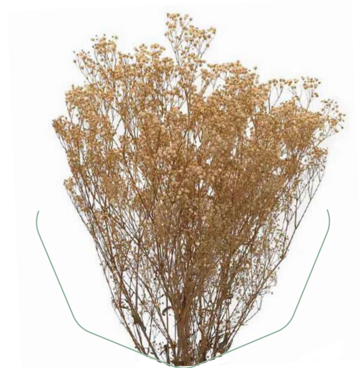
Gypsophila Cream GYP/4020