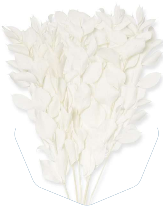
White Ruscus RUS/0005