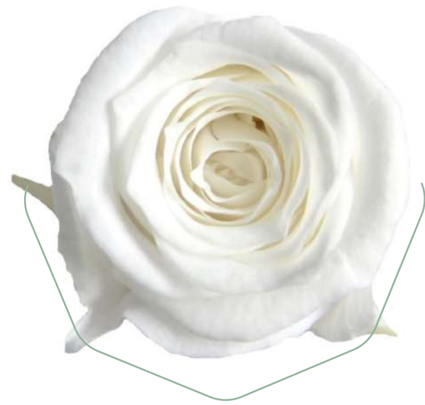
Rose Princess White RSP/4000