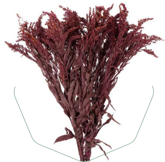
Solidago Red SOL/0204