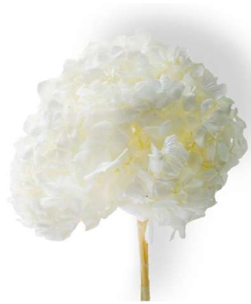
Hydrangea / White HRT/0000