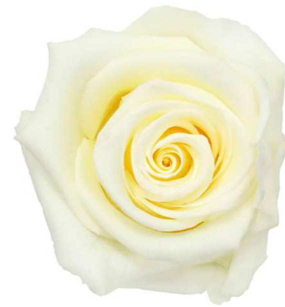
Vainilla Cream RST/2030