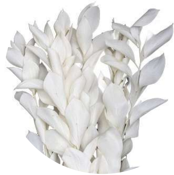
White Ruscus RUS/0005