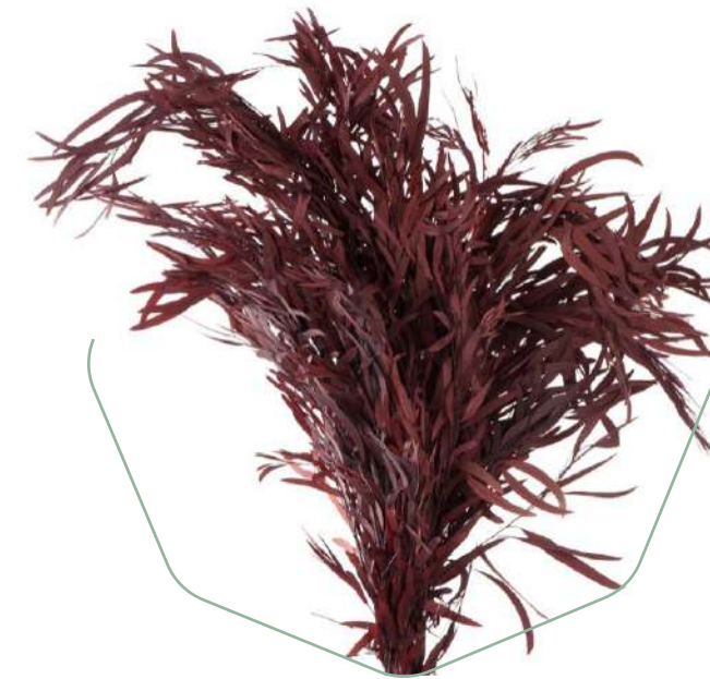
Nicolay Red NIC/0204