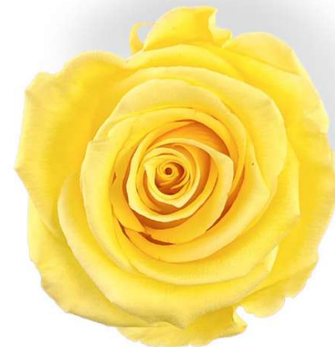
Rosa Standard / Soft yellow RST/2330