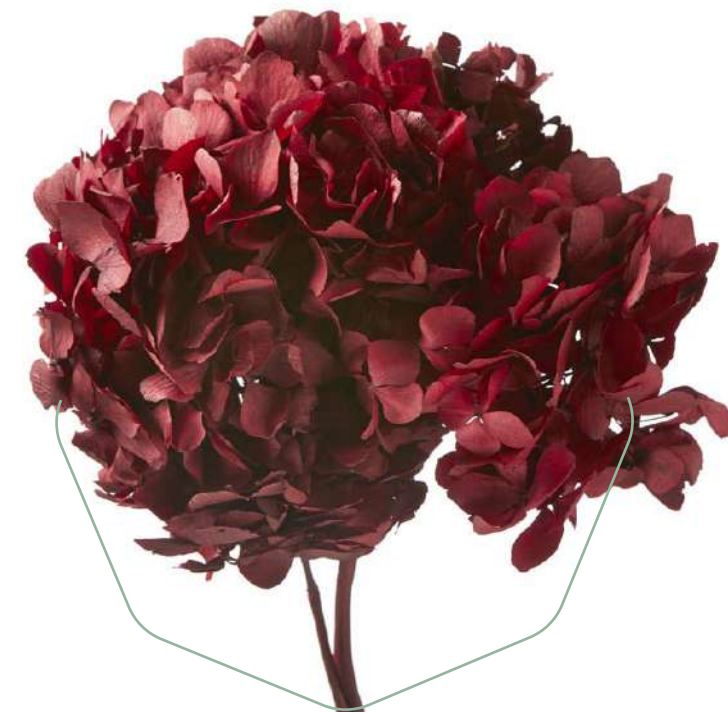
Hydrangea Red HRT/0200