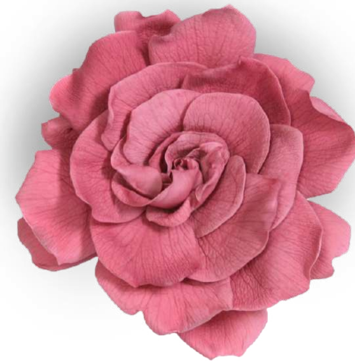
Cherry Vintage GAR/2480