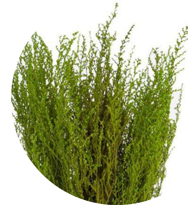
Stoebe Verde STB/0103