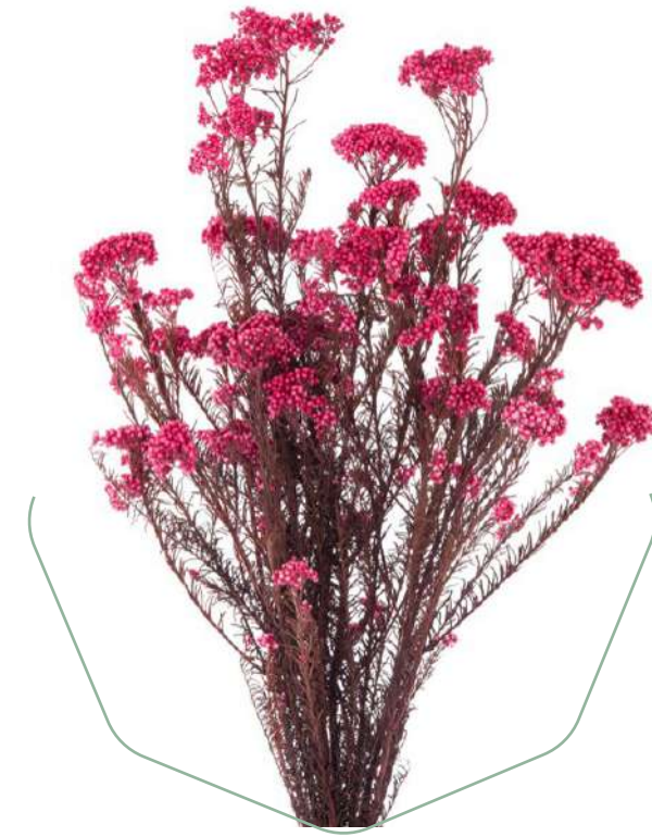
Rice Flower Pink HDI/0440