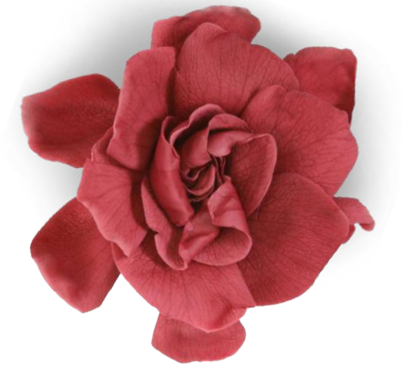
Gardenia / Burgundy GAR/2800