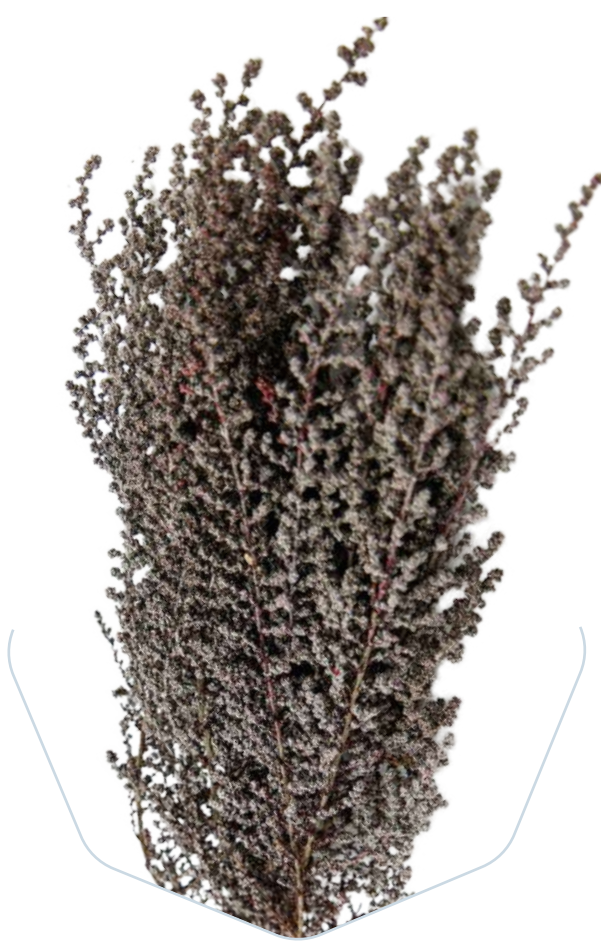
Stoebe Plata STB/0003