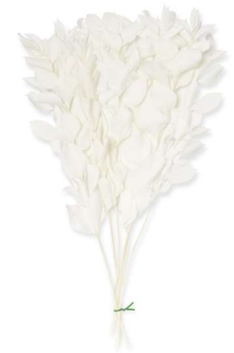
White Ruscus RUS/0005