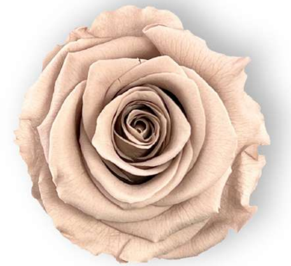
Rosa Standard /Hazelnut RST/2910