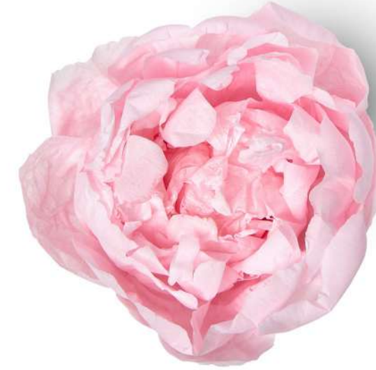
Peonia / Pastel Pink PEO/2420