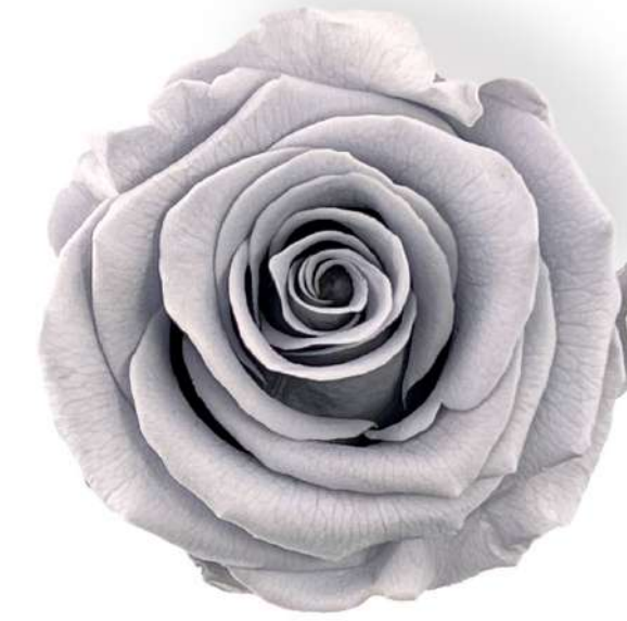
Rosa Standard / Silky grey RSP/2180