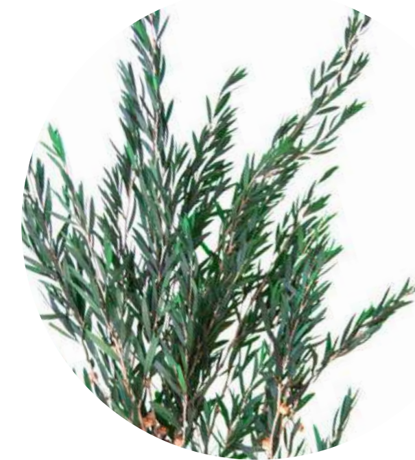
Lepto Lungifolia LPL/9104