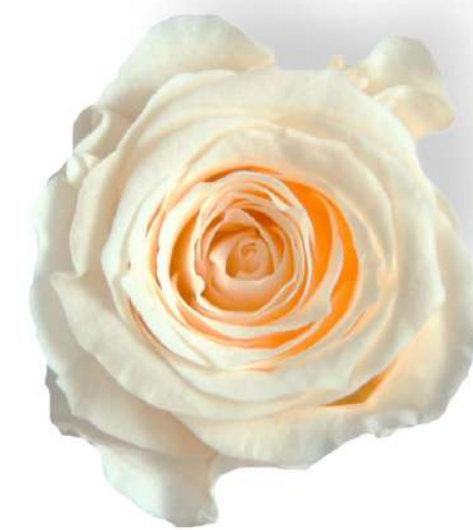
Rosa Princess / Champagne RSP/4020