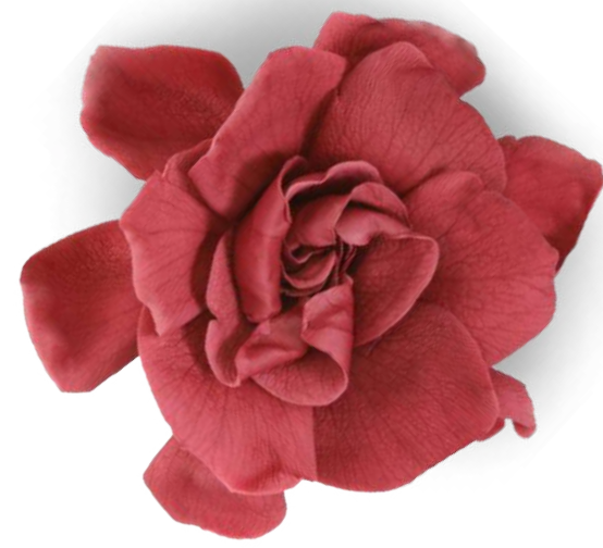
Gardenia / Burgundy GAR/2800