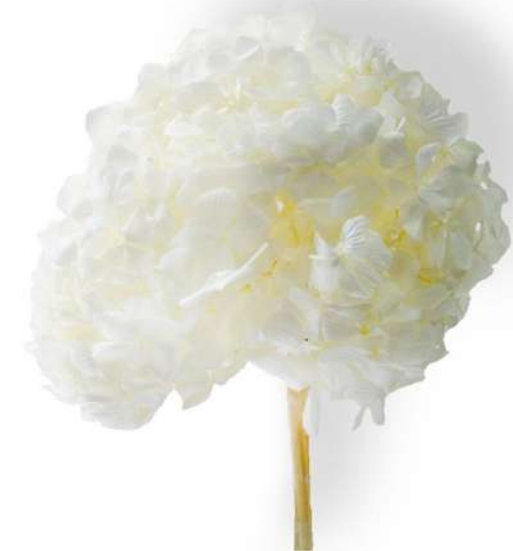
Hydrangea / White HRT/0000