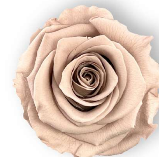
Rosa Standard /Hazelnut RST/2910