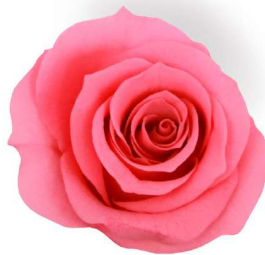
Rosa Princess / Pastel Pink RSP/4420