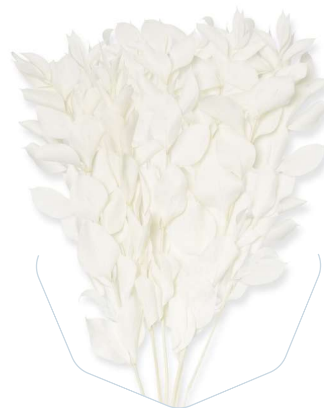
White Ruscus RUS/0005