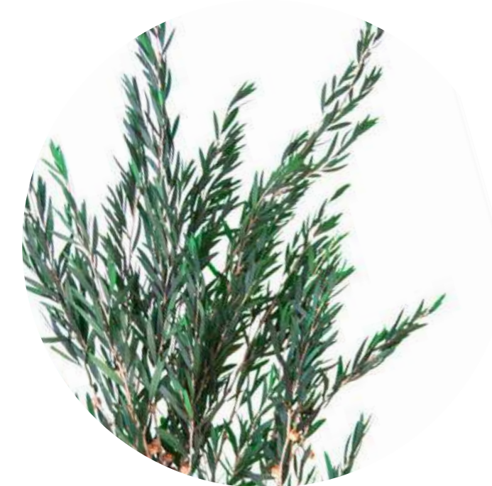
Lepto Lungifolia LPL/9104