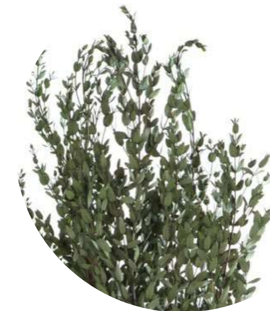
Eucalipto Parvifolia PAR/0104