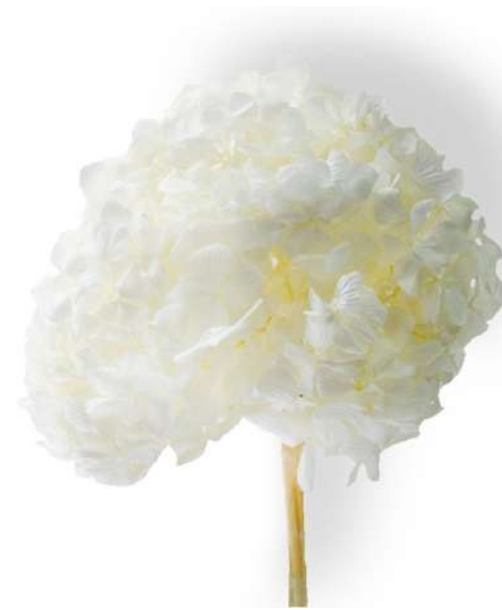
Ortensia / White HRT/0000