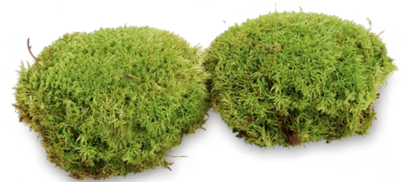
Muschio palla MOB • 2100N-FR