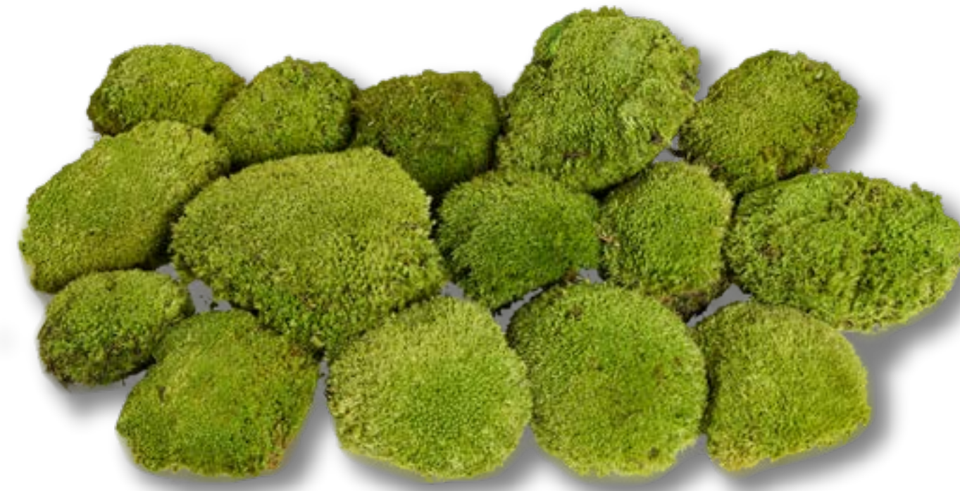
Muschio palla MOB • 2100N-FR