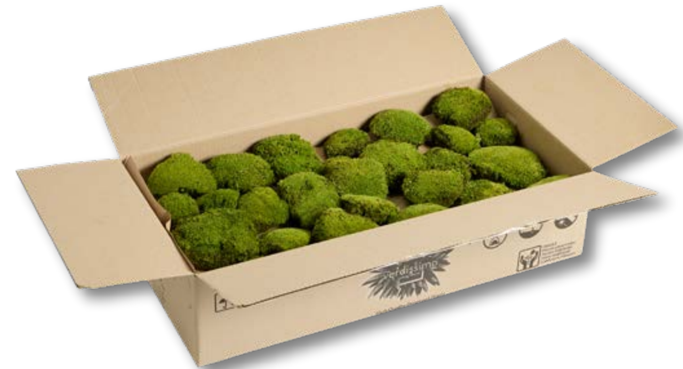
Muschio palla MOB • 2100N-FR