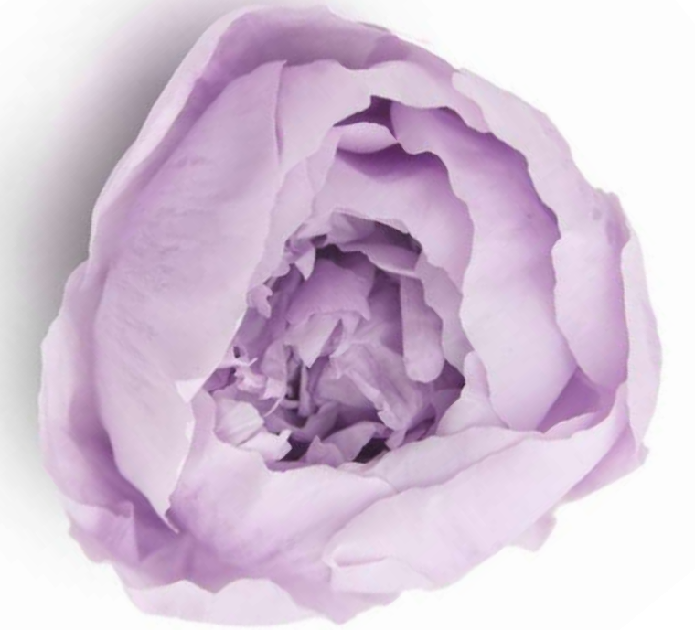
Soft Lilac PEO/2820