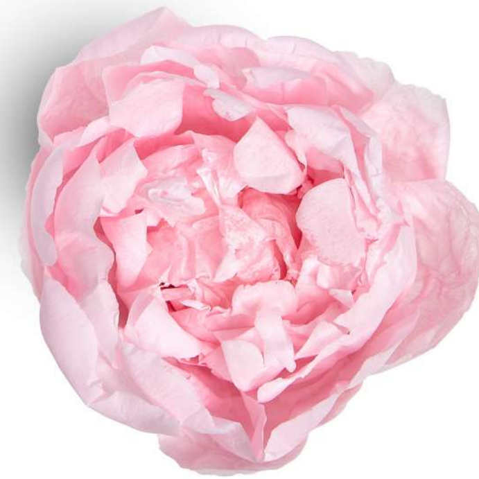
Pastel Pink PEO/2420